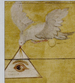
Ein biblisches Motiv zuoberst im Ründihimmel: Das Auge Gottes.