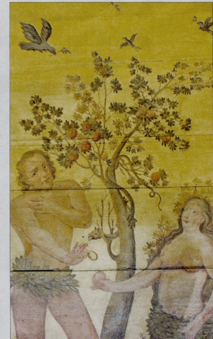
Paradiesisch: Adam und Eva nach vollendeter Restaurierung.